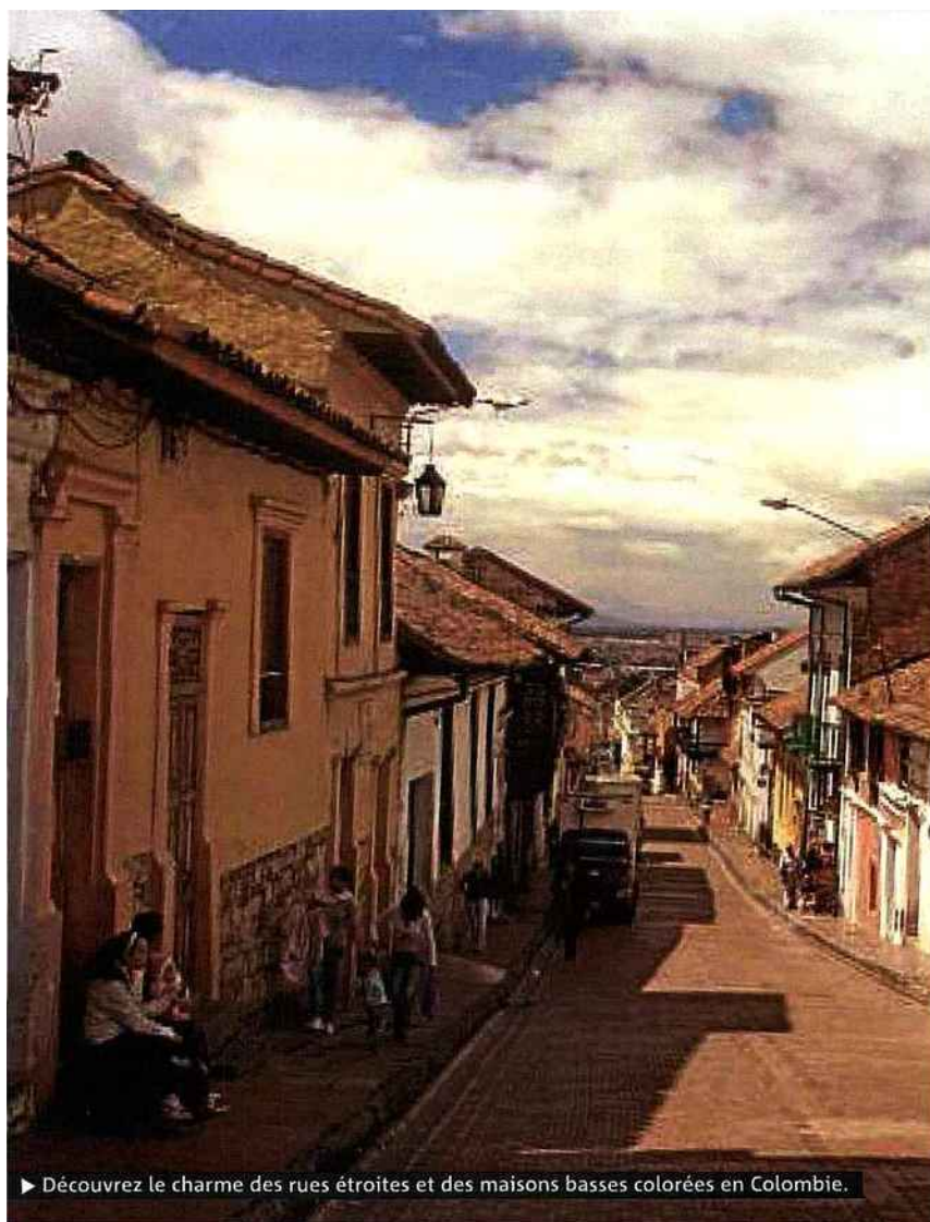
► Découvrez le charme des rues étroites et des maisons basses colorées en Colombie.